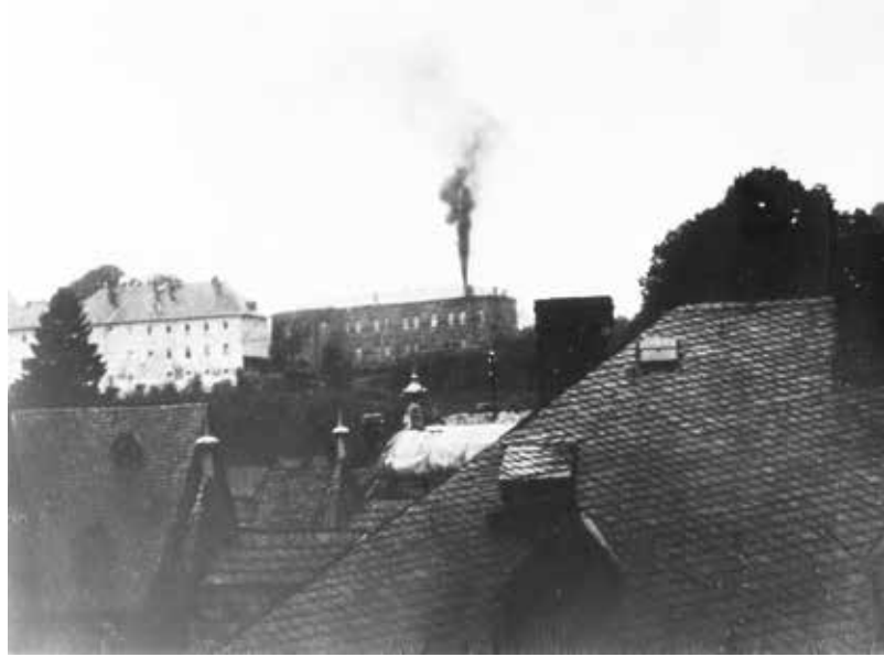
Rauch über der Tötungsanstalt Hadamar, 1941