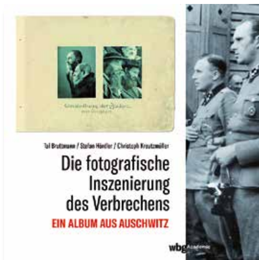
Titel des Buchs Die fotografische Inszenierung des Verbrechens. Ein Album aus Auschwitz