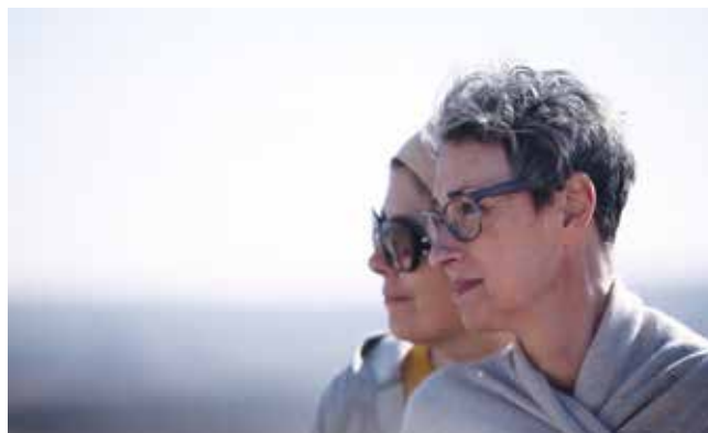
Titelbild des Films You look so German!