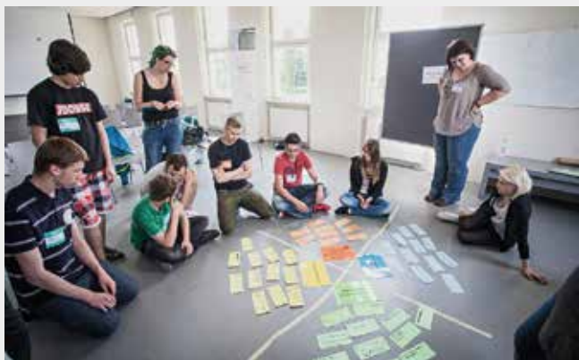
Seminar im Erinnerungsort

Die Zahl der Teilnehmenden ist begrenzt. Soweit nicht anders angegeben, wird deshalb eine Anmeldung erbeten an: fsj.topfundsoehne@erfurt.de