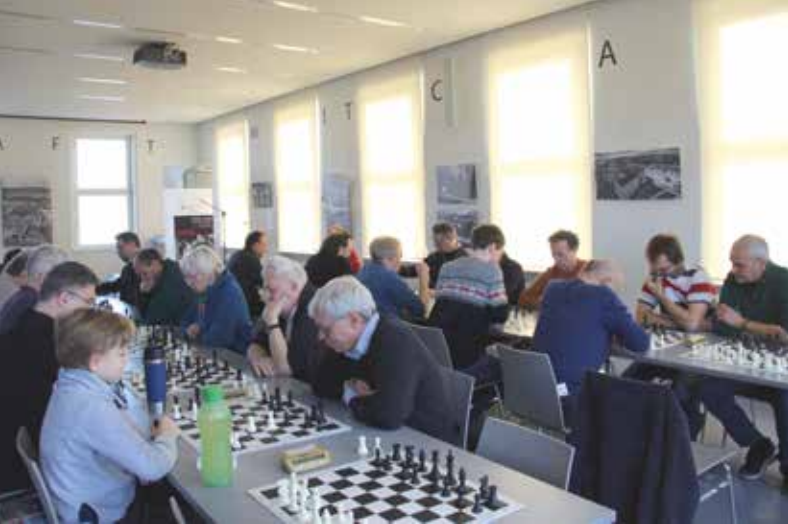
6. Königsgambit-Gedenkturnier, 2019