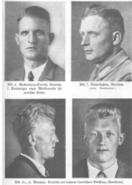
„Die nordische Rasse“, Hans Friedrich Karl Günther „Kleine Rassenkunde des deutschen Volkes“ (1929)

der Universität organisierte Gemeinschaftsvorlesung über Die Judenfrage als plumpe Demagogie im Sommersemester 1943: „Es ist für uns nicht damit abgetan, daß wir die Judenfrage im Reich weitgehend gelöst haben. Sie ist eine Weltfrage, mit der dieser Krieg und seine immer heftiger werdenden Kämpfe zusammenhängen.“